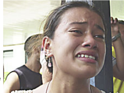
El cadáver del soldado fue trasladado al Hospital Universitario para hacerle la autopsia

Agregó: "Esto es un vandalismo lo que han hecho aquí, los militares y el gobierno de turno... ayer estaba muy contento, fue su mejor día... esto no puede ser... a mí nadie me ha explicado nada, ni los médicos ni nadie, no he recibido información de nada... mi hijo me preguntaba cuándo nos vamos de aquí y repetía que no quería volver a Fuerte Mara. Los militares estaban todo el tiempo locos por entrar a ver a mi hijo y siempre escondidos y haciendo seguimientos, seguro ya entraron y lo mataron... este es un gobierno dictatorial, satánico y vandálico".